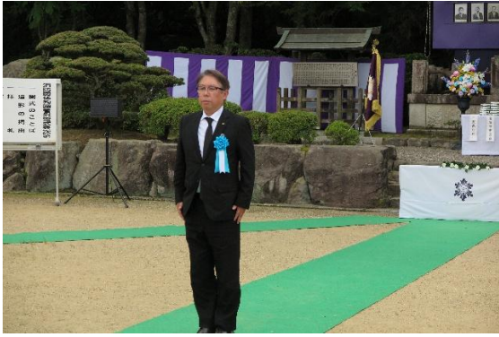
國松大津市副市長 献花