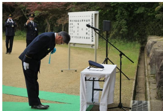
東滋賀県副知事 追悼のお詞