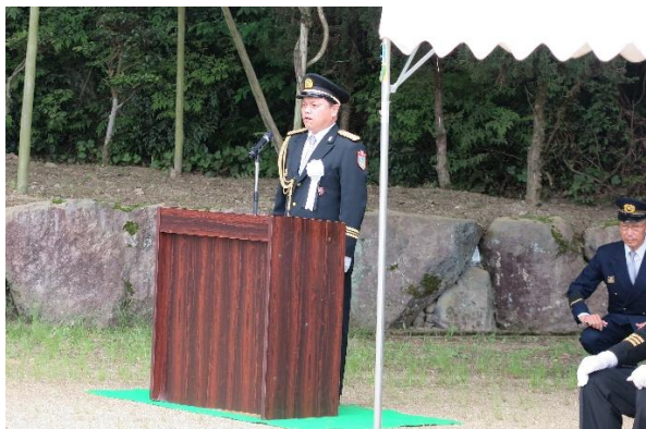
山本副会長（米原支部長）閉式のことば