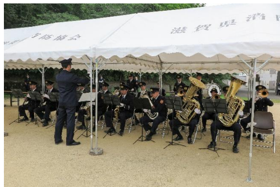
大津市消防局消防音楽隊