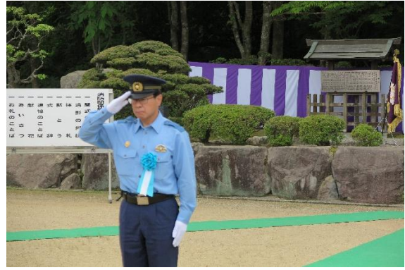
上村東近江警察署長 献花