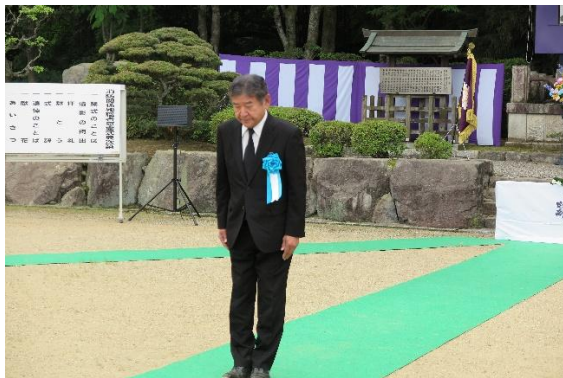
小椋市長会長 献花