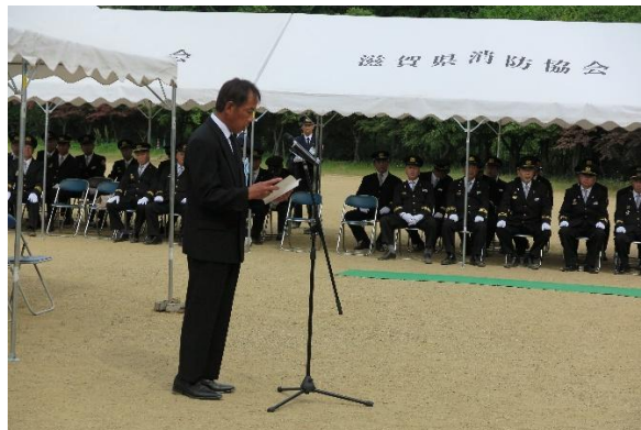
村田様（ご遺族代表）お礼のことば