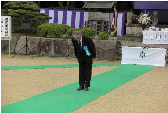
加藤滋賀県議会議長 献花