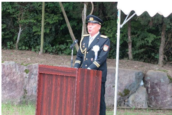
藤田副会長（豊郷町消防団長）あいさつ