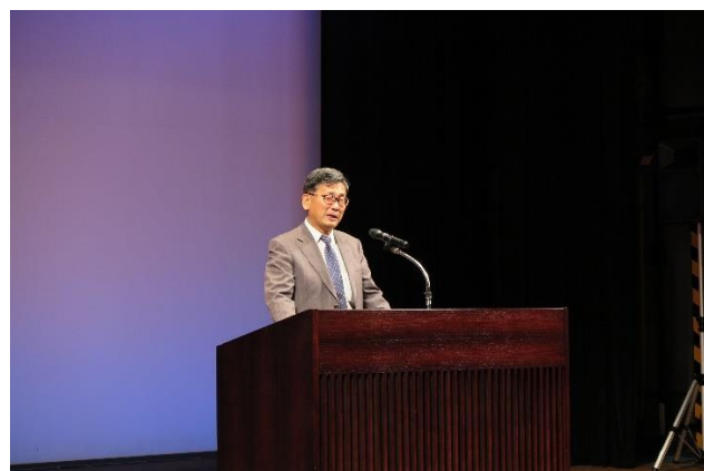
藤澤 直広 日野町長あいさつ